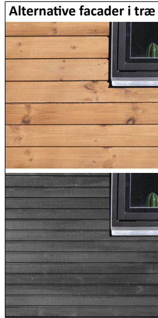
Alternative facader i træ