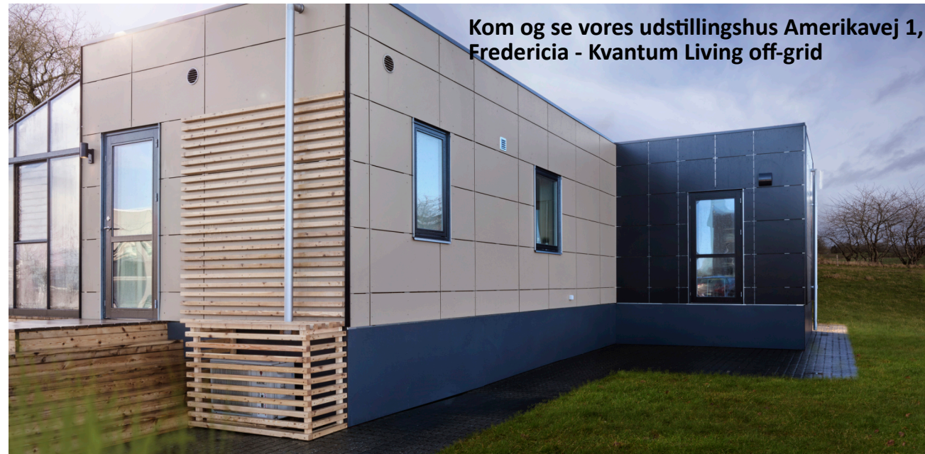
Kom og se vores udstillingshus Amerikavej 1, Fredericia - Kvantum Living off-grid